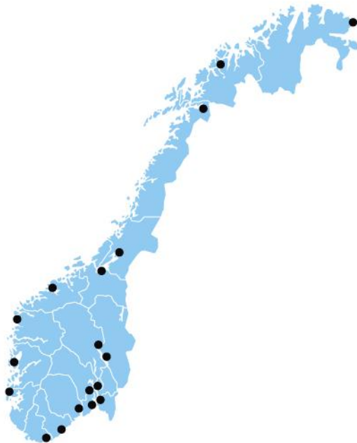
KONTORER I ALLE FYLKER