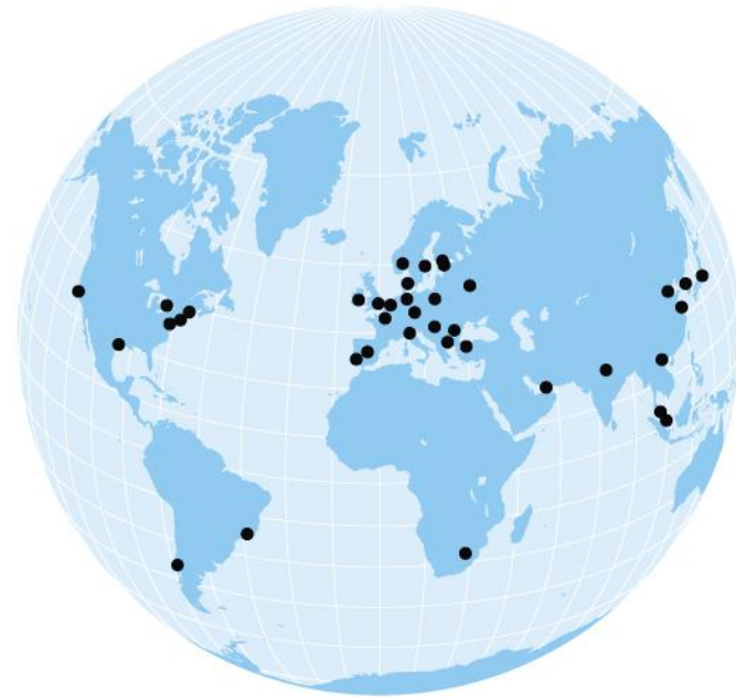
KONTORER I OVER 30 LAND